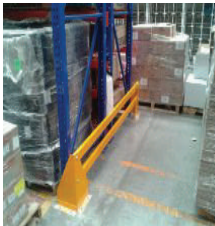
PROTECTOR TIPO BARANDAL