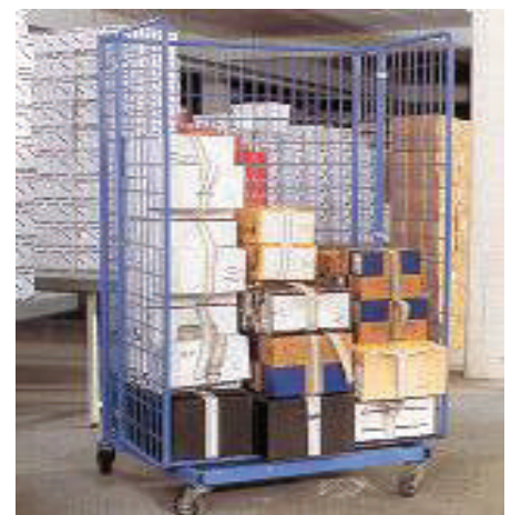
CARRO SURTIDOR DE PEDIDOS