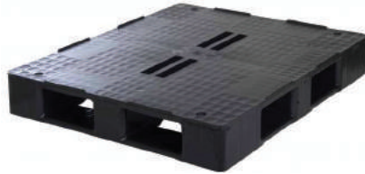
PALLETS DE PLASTICO