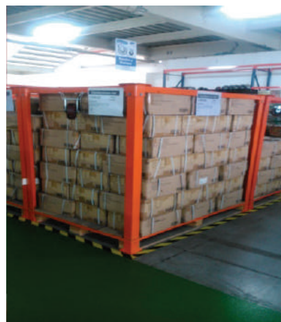
CONVERTIDOR DE TARIMA