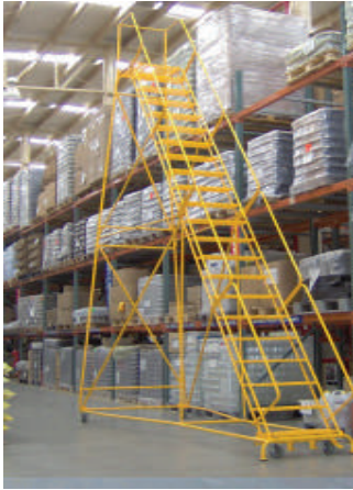
ESCALERA TIPO PLATAFORMA RODANTE PESADA