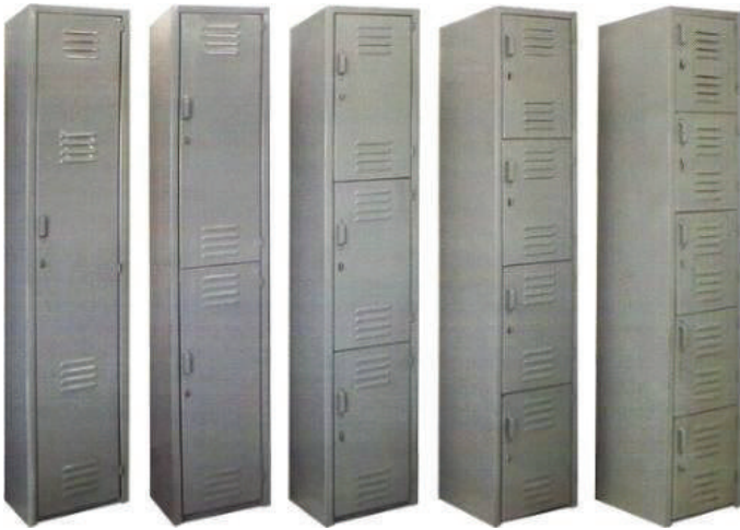
Lockers o Casilleros de uno a cuatro compartimiento pueden ser con porta candado o con chapa.