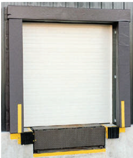
Sellos de Anden