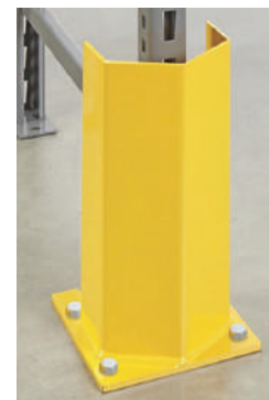
Protector de columna