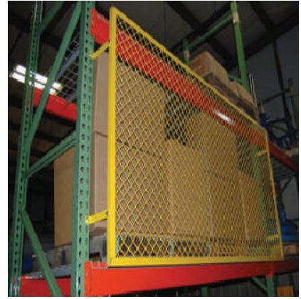
Protector Trasero de Racks