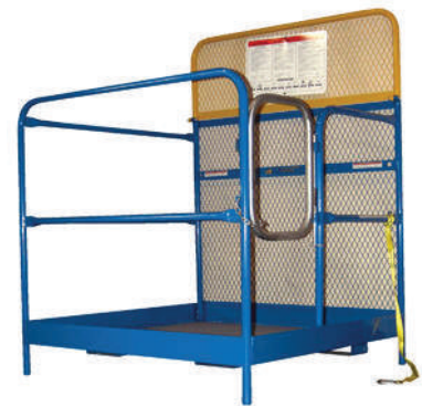
Plataforma para Trabajo