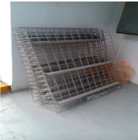
PARRILLA METALICA REFORZADA