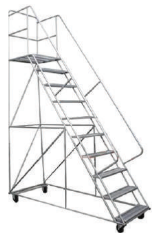
ESCALERA DE AUTOSERVICIO