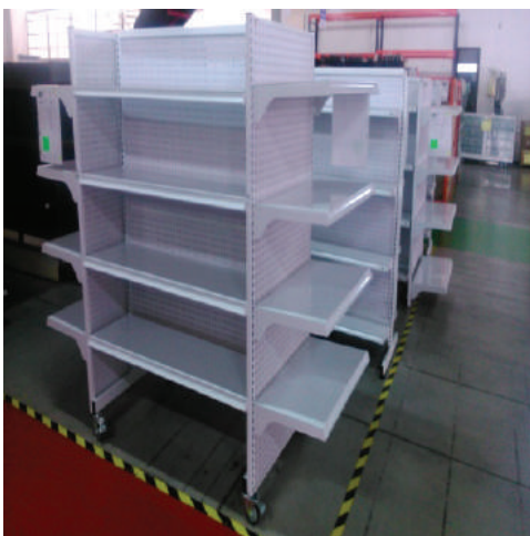
GONDOLAS DE AUTOSERVICIO