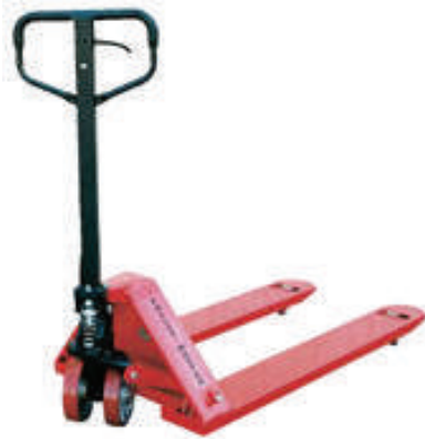
Patines Hidráulicos Para manejo de materiales.