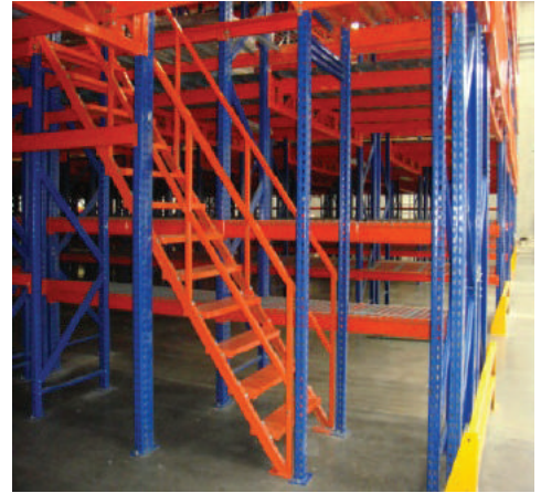
ESCALERA DE SERVICIO